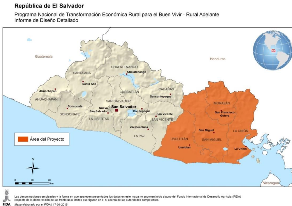
Figura 1. Zona del Programa

Objetivo del Programa. El Objetivo de desarrollo de Rural Adelante es Incrementar los ingresos de forma sostenible de familias rurales en condición de pobreza en los departamentos de San Miguel, Usulután, La Unión y Morazán. La Meta es Contribuir a reducir la pobreza rural en la región oriental de El Salvador.